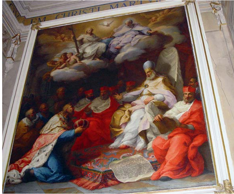
(Cesare Baronio in un affresco della Cattedrale di Veroli)