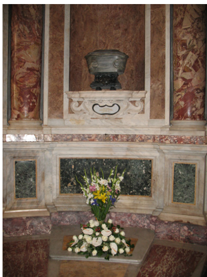
Le Reliquie del Ven. Baronio nella cappella di S. Carlo della “Chiesa Nuova”